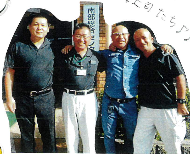
本後 小牧 峰崎 大曲

南部総合センターは、4月より2名の new 課長と、new センター長を迎え日々の 仕事に精進しております！これから、